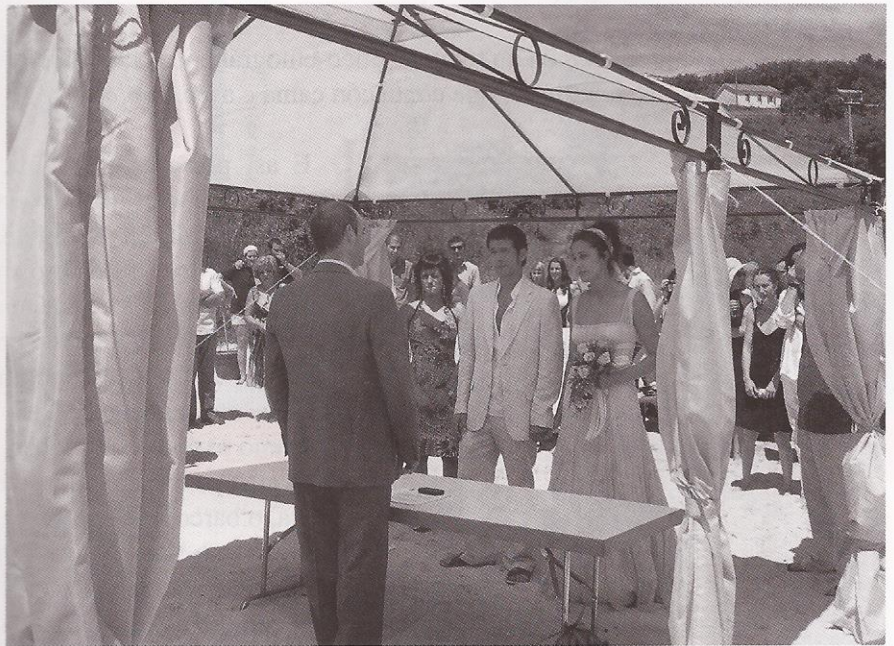
Foto 2.- Primeira voda celebrada na Illa, concretamente na Praia de Area dos Cans no ano 2008. Fai de oficiante o alcalde de Bueu.

Realizouse na praia de Area dos Cans, co alcalde de Bueu como oficiante, cunha vestimenta moi lixeira e un menú propio illán: Ameixas e Caldeirada de Polbo. Pero, non só se conformaron co banquete na Illa, senón que decidiron pasar alí a noite xunto aos seus invitados. Estiveron aloxados nas habitacións de aluguer dispoñibles. Á noite unha boa cea a base de churrasco, continuando logo cunha festa con queimada na praia, con fogueira incluída, xa que coincidiu coa noite de San Xoán. (Por certo a fogueira era unha pequena Cacharela de San Xoán que a Asociación Pineiróns realizou na Praia das Dornas contando co permiso previo de Parques).