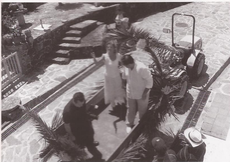
Foto 3.- Despois da cerimonia no barco fronte a engaiolante Praia de Melide, os noivos diríxense a realizar as fotos na zona do Faro. 2010.