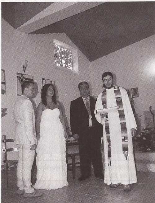
Foto 5.- Primeira voda foránea celebrada na igrexa. A última fora duns veciños illáns hai 40 anos.

Moitas veces búscanse lugares afastados para facer os convites, coidando que o afastado é o mellor. Sen embargo non caemos na conta de que unir praia,