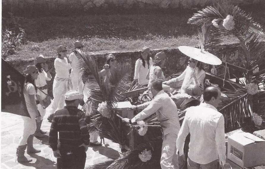
Foto 1.- Unha das moitas despedida de solteira celebrada en Ons. Como podemos ver polos seus enfeites e aderezos, a festa está garantida.

Curiosamente hai máis de corenta anos que as vodas dos veciños de Ons deixaron de celebrarse na Illa, sen embargo, dende hai 13 anos, as vodas foráneas van en aumento.