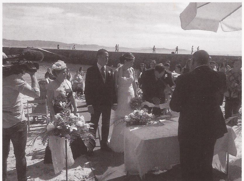
Foto 6.- A penúltima voda celebrada na Praia das Dornas, en Ons no ano 2013.

Estou segura que este enclave será testemuña, cada vez máis, dos “Si Quero” de moitos galegos que buscan unha voda alternativa e diferente nun lugar especial.